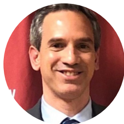
Palestrante Ravvi Madruga (Coordenador-Geral de Promoção da Concorrência do Ministério da Fazenda)