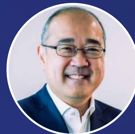
Ricardo Morishita Wada Secretário Nacional do Consumidor Senacon / MJSP